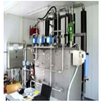
台灣愛克德基公司無塵室封裝與通量測試