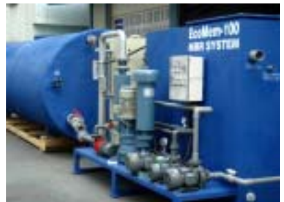
台灣愛克德基公司進口歐美日 MBR 組件,組裝各型模組與套裝 MBR 設備

現有歐美亞市場膜濾生物反應系統(MBR)採用的膜濾產品,主要分為中空絲膜(Hollow fiber membrane)與片狀或板狀濾膜(Flat sheet/plate membrane)。台灣愛克德基公司分別歐美日排名第一的膜濾(membrane)製造公司技術合作,依原廠規範組裝,推出下列浸水型膜濾生物反應模組(Immersed MBR Modules),其 membrane 分別有 PAN,PES,PVDF,PTFE 材質,提供客戶更廣泛的選擇: